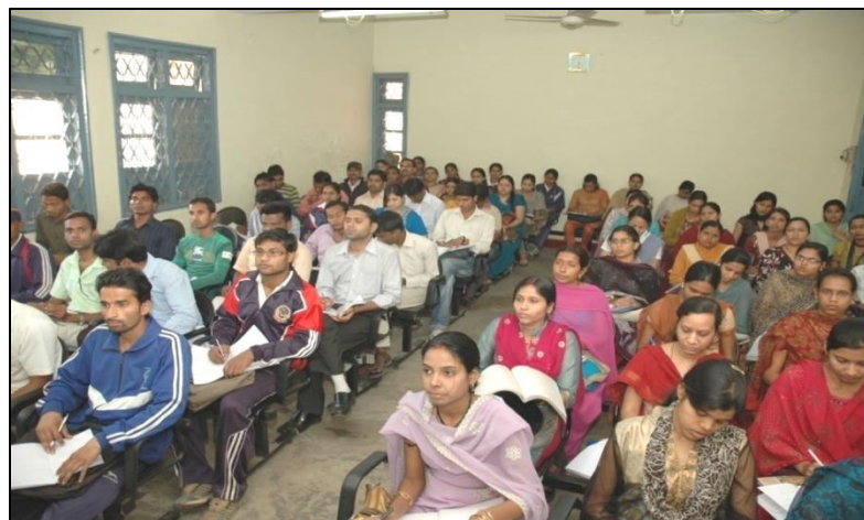
Photographs of NET Coaching 2012