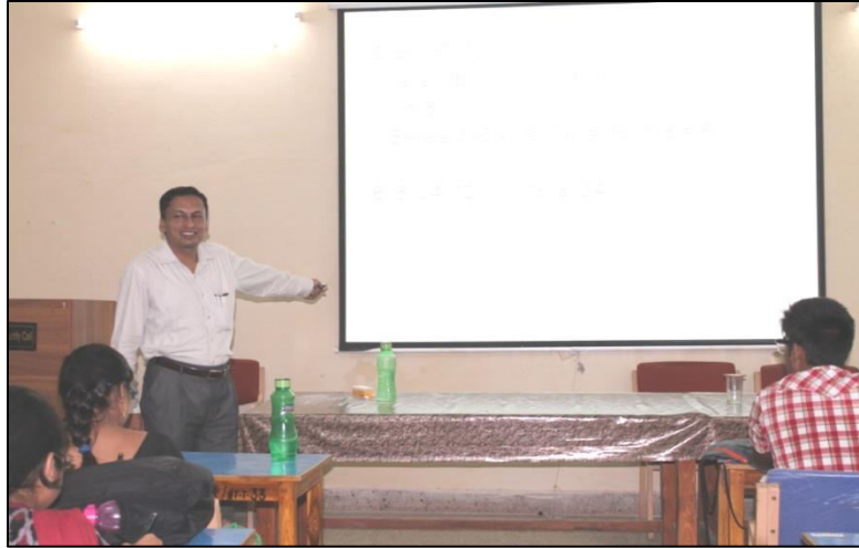
Photographs of Reasoning Coaching