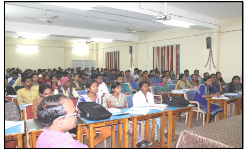
Photographs of PSC Pre. 2015 Coaching