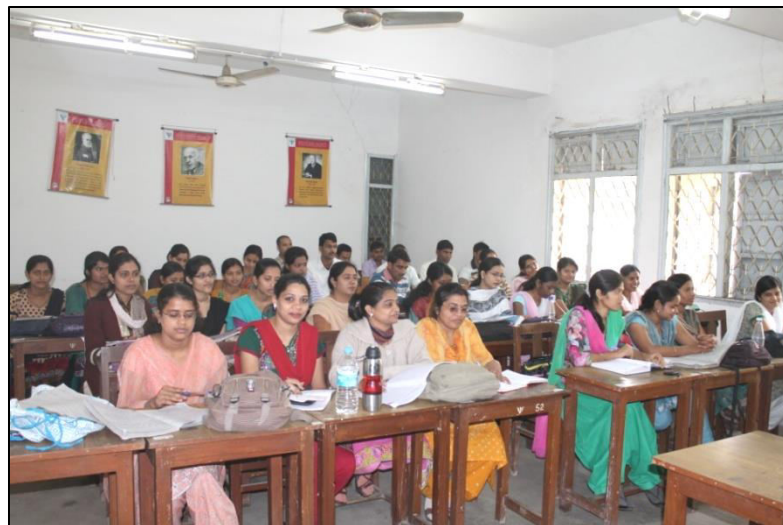
Photographs of NET Coaching 2014