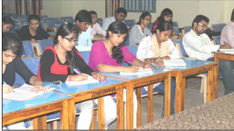
Photographs for Bank & SSC exam