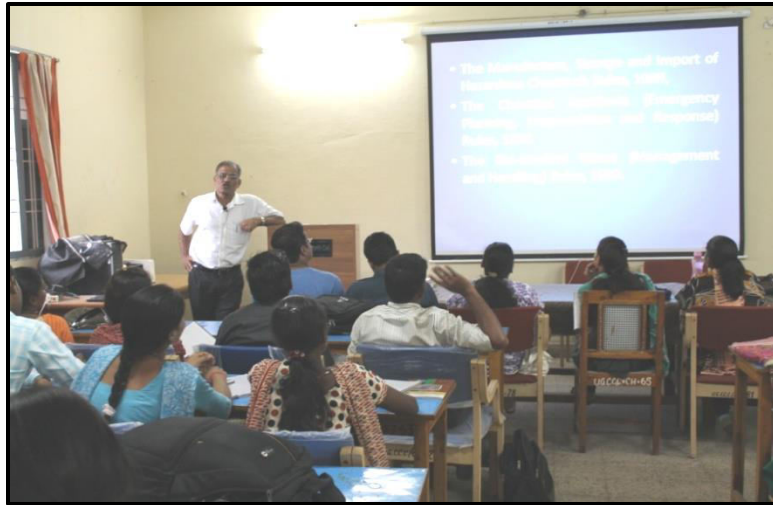
Photographs of PSC Pre. 2014 Coaching