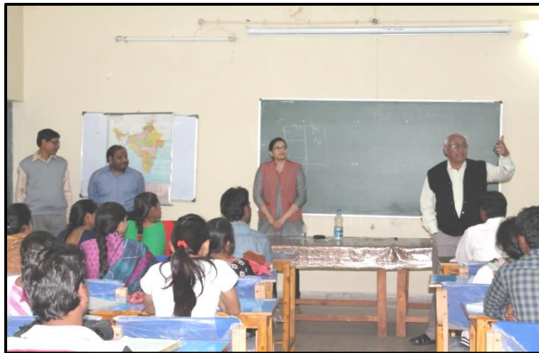
Photographs of PSC Pre. Coaching guidance by Hon. Vice Chancellor