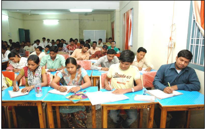
Photographs of Spoken English Coaching