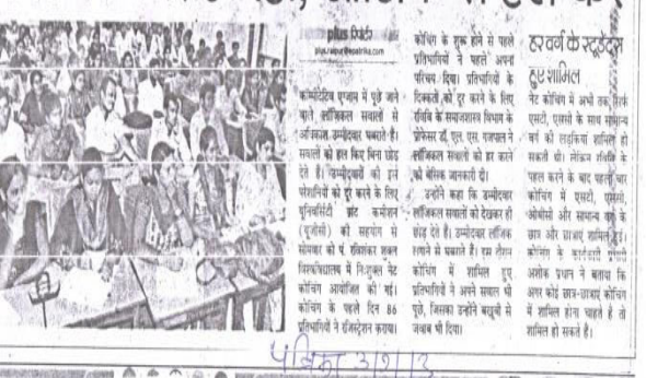
कोचिंग सेंटर में छात्र-छात्राओं का अध्ययन।