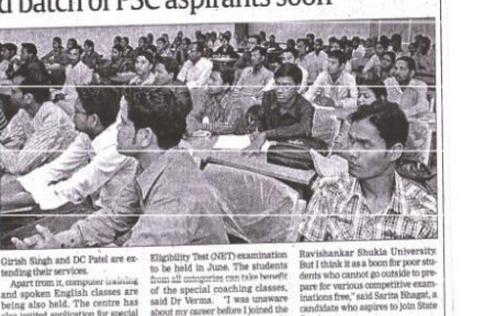
कोचिंग सेंटर में छात्र-छात्राओं का अध्ययन।