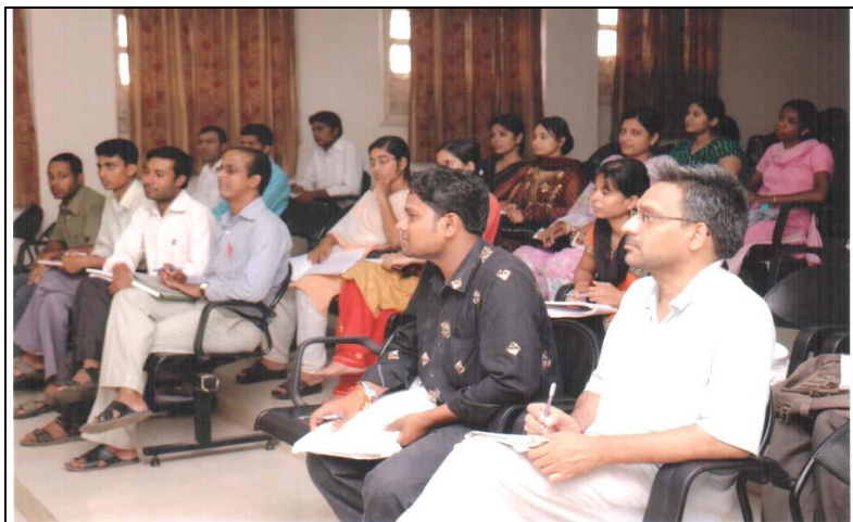
Photographs of NET Coaching 2011

P H O T O G R A P H S O F N E T / S E T C O A C H I N G