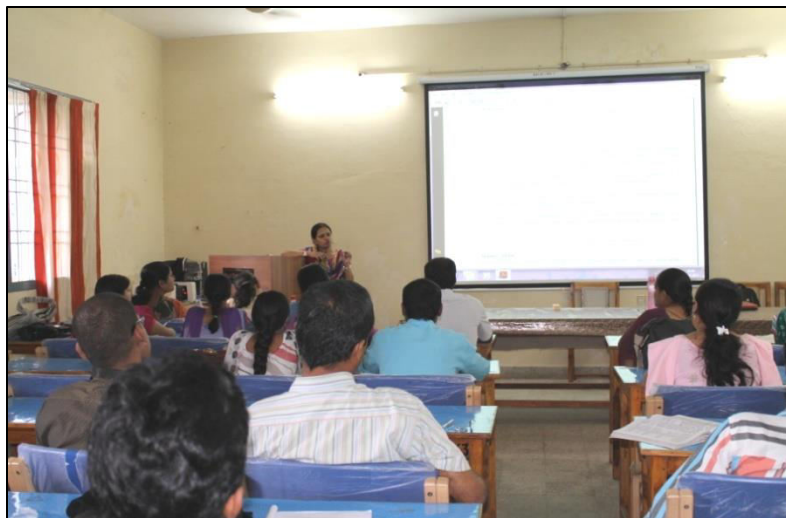
Photographs of NET Coaching 2013