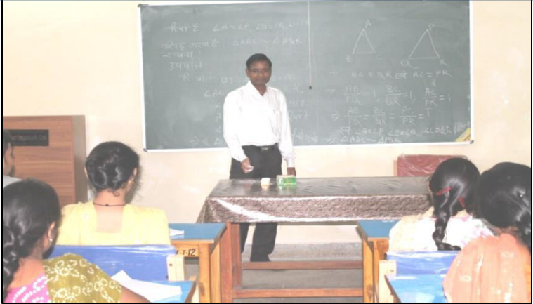
Photographs of Maths Coaching