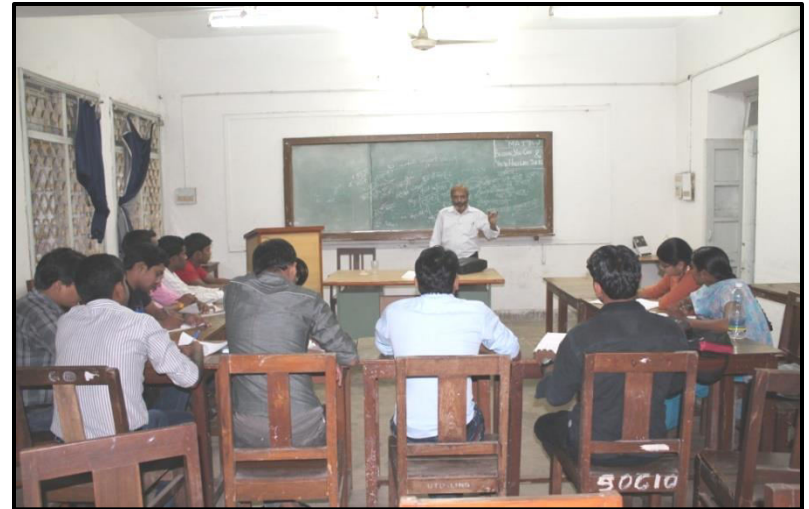
Photographs of PSC Mains Coaching